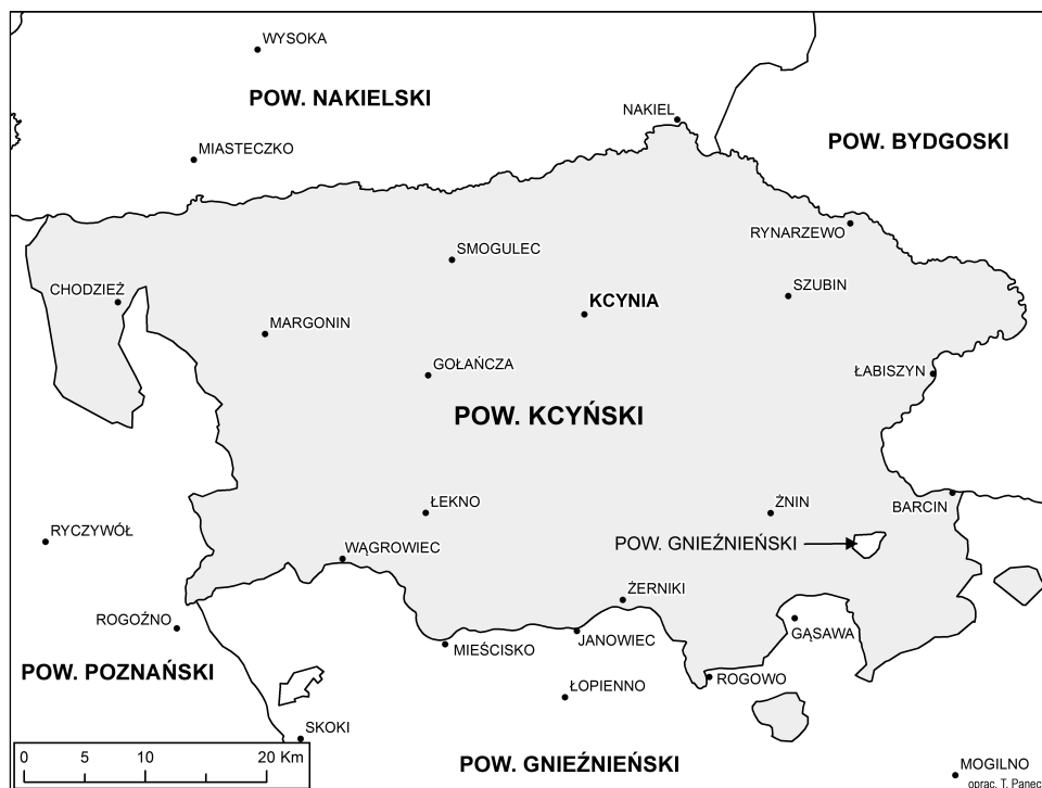
Mapa 1. Powiat kcyński w 2. poł. XVI w.

dobry oskarżonego ( actor sequitur forum rei ) 10 . Powiat sądowy nie był w swym założeniu pojęciem terytorialnym, lecz przede wszystkim instytucją: do powiatu należał właściciel, a nie jego dobra. Według Antoniego Gąsiorowskiego dla początkowego okresu nie można mówić o ściśle wydzielonych granicach konkretnego powiatu, a i potem określić je można precyzyjnie tylko w tym przypadku, gdy przebiegały między dobrami szlacheckimi 11 . U schyłku XV w. sytuacja ta zaczęła się zmieniać w związku ze stopniowym upadkiem sądownictwa ziemskiego. Osłabieniu uległa sądowa odrębność powiatu. Jednocześnie rozwijający się aparat fiskalny doprowadził do stopniowego „uterytorialnienia” powiatów 12 . Ze względów praktycznych podział na województwa (a wewnątrz nich na powiaty) zaczęto bowiem wykorzystywać do rejestrowania podatników