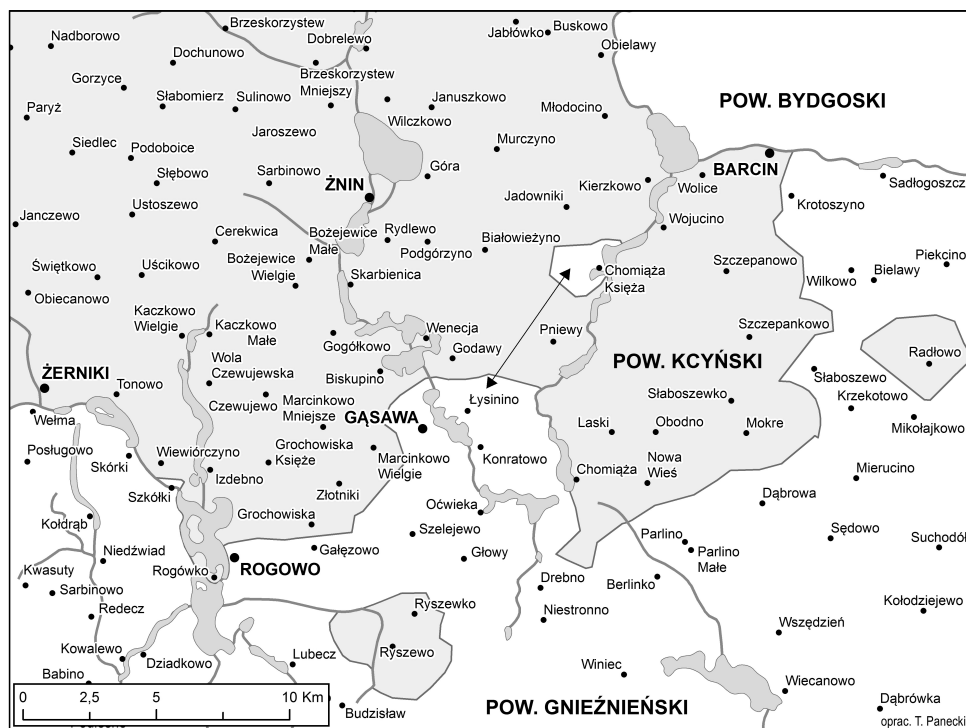
Mapa 2. Granica powiatów kcyńskiego, gnieźnieńskiego i bydgoskiego w końcu XVI w.

jednak także ich alternatywną przynależność do powiatu gnieźnieńskiego 21 . Wsie Chomiążę Księżą (parafia Ostroszcze) rejestry poborowe notują w powiecie gnieźnieńskim 22 . Działo się tak być może ze względu na wygodę płatnika poboru, którym była tu sufragania gnieźnieńska 23 . Znaczne oddalenie tej wsi od granicy powiatowej oraz brak innych źródeł potwierdzających istnienie tego rodzaju eksklawy administracyjnej skłania do dopuszczenia założenia, że Chomiąża Księża znajdowała się w owym czasie w granicach powiatu kcyńskiego 24 .