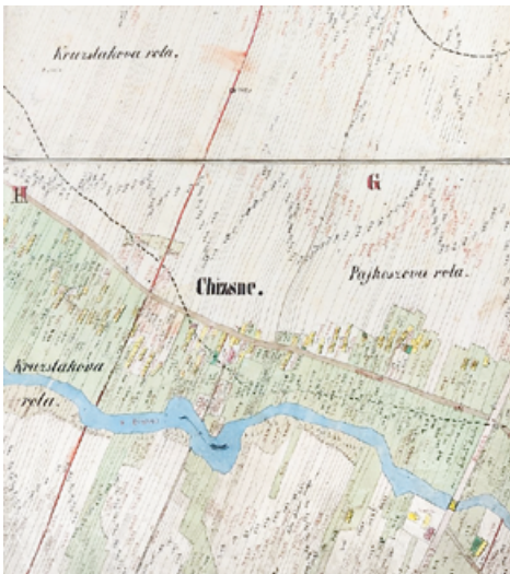
Ryc. 2. Chyzne – łańcuchówka naprzemianległa.