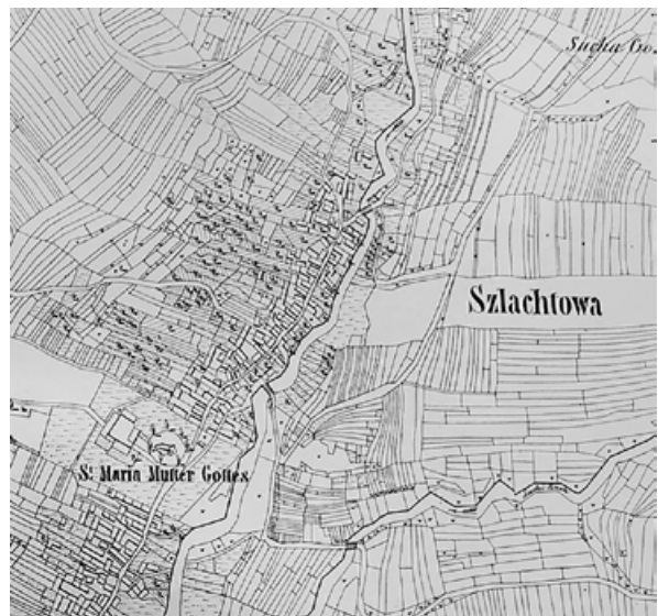
Ryc. 6. Przykład nawsia z obiektami sakralnymi w Szlachtowej.

Rozrost zabudowy zaobserwowano w Szczawnicy – z pierwotnej łańcuchówki jednostronnie zabudowanej przeistoczyła się w układ wielodrogowy. Nowe domostwa powstały w sposób nieregularny w obrębie dawnych łańców gospodarzy przy granicy niwy siedliskowej. W dalszej części zachował się leśno-łańcowy układ rozłogów. We wsi obserwujemy widoczny dawny układ