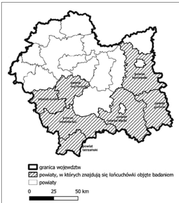
Ryc. 1. Obszar badań.

ich dalszych przekształceń przestrzennych, a także dostępność materiałów źródłowych i kartograficznych. Ze względu na występowanie bardzo dużej liczby łańcuchówek na terenach górskich analizy obejmowały tylko wybrane przykłady wsi w południowej i wschodniej części województwa małopolskiego położone w powiatach: gorlickim, myślenickim, nowosądeckim, nowotarskim, suskim, tarnowskim i tatrzańskim (ryc. 1). Artykuł przedstawia wstępne wyniki badań nad tematem i stanowi wprowadzenie do dalszych, bardziej dokładnych analiz.