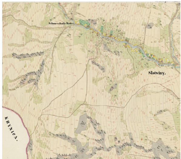
Ryc. 3. Słotwiny – łańcuchówka dwustronnie zabudowana.

Rzepiennik Strzyżewski i Biskupia) 39 . Natomiast wsie skupione dominowały w obecnym powiecie tatrzańskim, np. Ciche, Witów i Ratułów 40 . Typ skupiony reprezentowała również wieś Szczawnica (dawna nazwa Szczawnica Niżnia; pow. nowotarski) 41 .