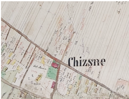
Ryc. 4. Przykład nawsia z obiektami sakralnymi w Chyznem.