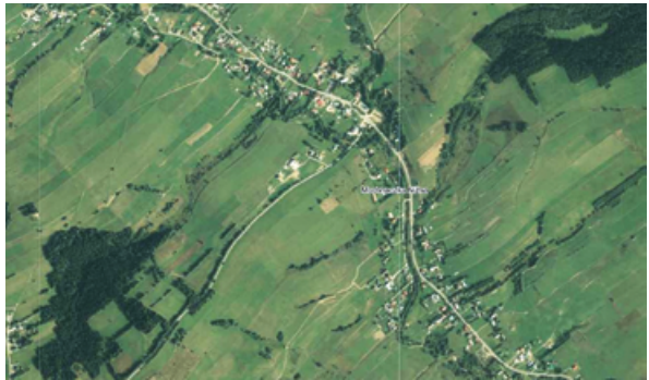
Ryc. 11. Wieś Mochnaczka Niżna.