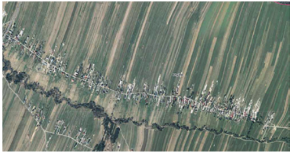
Ryc. 10. Wieś Chyżne.