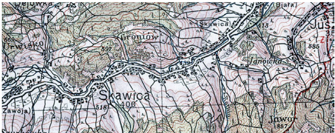
Ryc. 7. Skawica – przykład przemiany łańcuchówki jednostronnie zabudowanej w łańcuchówkę dwustronnie zabudowaną.