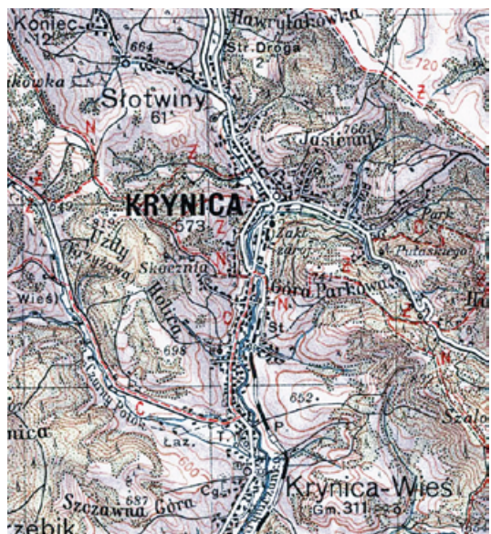
Ryc. 9. Krynica, Słotwiny oraz Krynica-Wieś.

typowo miejski charakter 74 . Rozpoczął się ruch budowlany w mieście, wzniesiono liczne wille, pensjonaty, hotele, łaźnię miejską i halę targową. Pod koniec lat