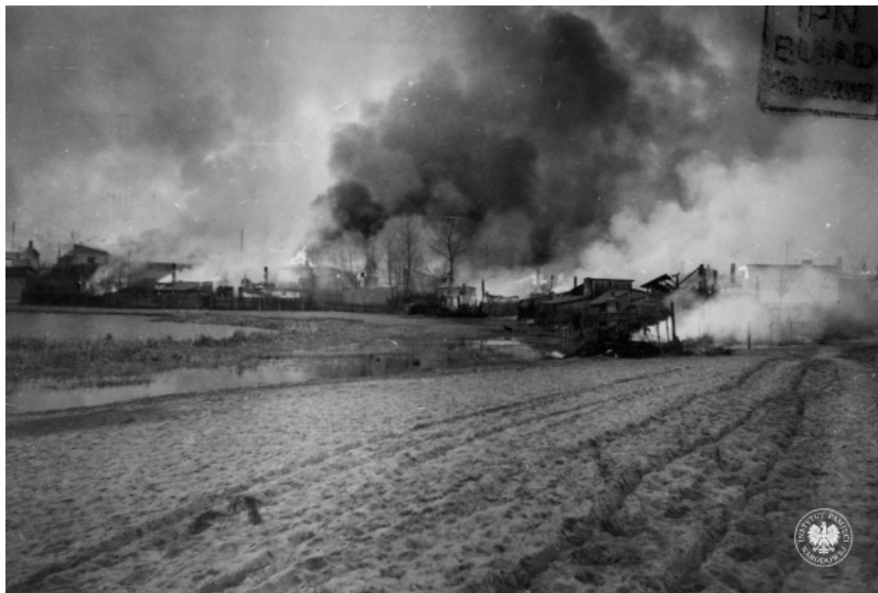
Ryc. 4. Grzywno w grudniu 1939 r.