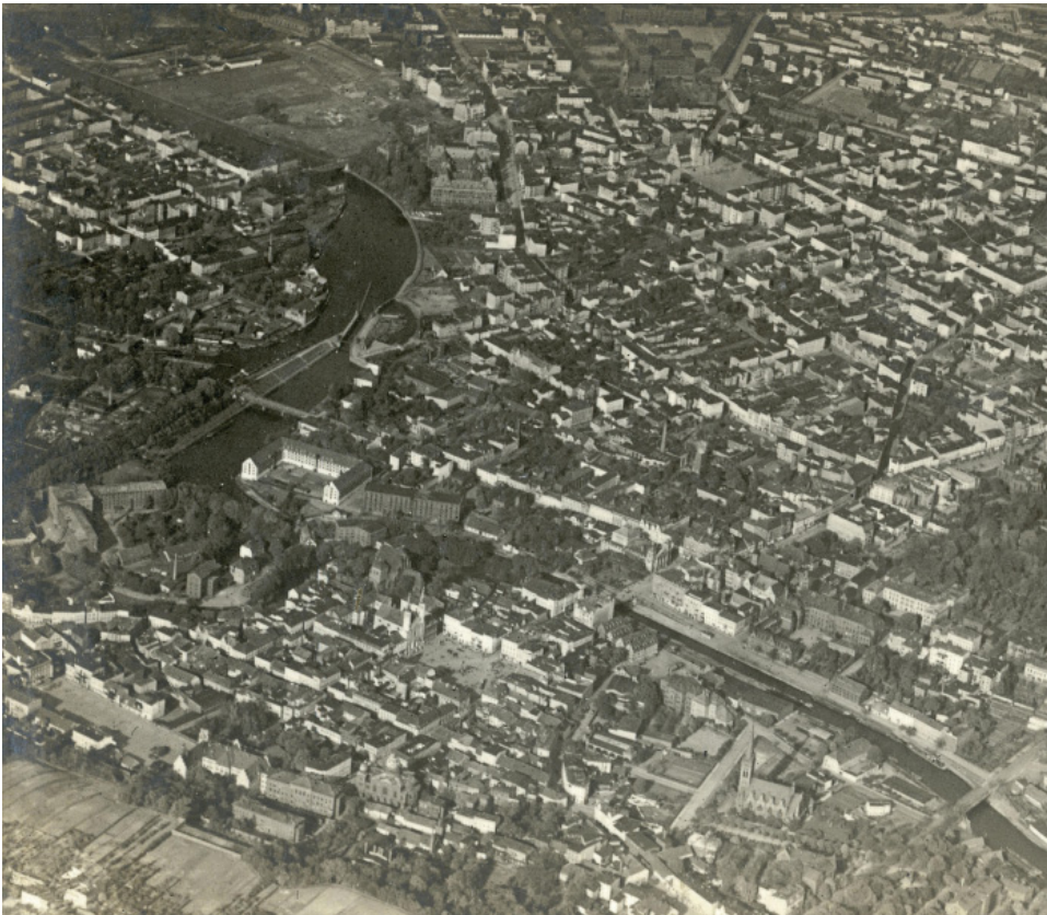
Ryc. 2. Stereoskopowa fotografia lotnicza Bydgoszczy wykonana w 1939 r. W centralnej części widoczny kościół Jezuitów na Starym Rynku oraz budynek teatru. Autor nieznany. Źródło: Archiwum Państwowe w Bydgoszczy, sygn. 6/2233/1494

Artykuł nie wyczerpuje zagadnienia, które wymaga pogłębionej kwerendy historycznej dla poszczególnych miejscowości. Należy zaznaczyć, że być może precyzyjne ustalenie wszystkich strat wojennych w województwie nie jest możliwe.