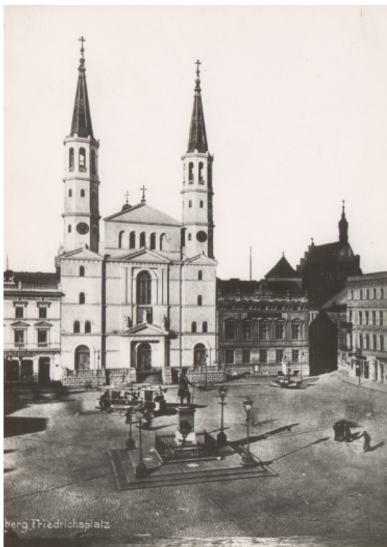
Ryc. 7. Kościół Jezuitów na Rynku w Bydgoszczy ok. 1910 r. Autor nieznany.

Źródło: Wojewódzka i Miejska Biblioteka Publiczna w Bydgoszczy, sygn. MAGS 814_15_01