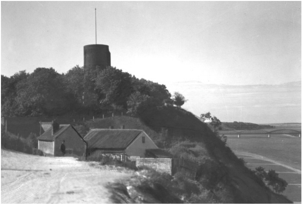
Ryc. 5. Wieża zamkowa „Klimek” w Grudziądzu zburzona przez Niemców w 1945 r. Autor nieznany.

Źródło: Narodowe Archiwum Cyfrowe, sygn. 3_1_0_9_1523_230332