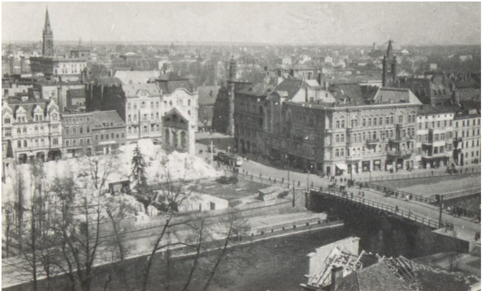
Ryc. 11. Powojenny widok na zniszczony teatr w Bydgoszczy. Autor nieznany.

Źródło: Wojewódzka i Miejska Biblioteka Publiczna w Bydgoszczy, sygn. MAGS 787_227_01