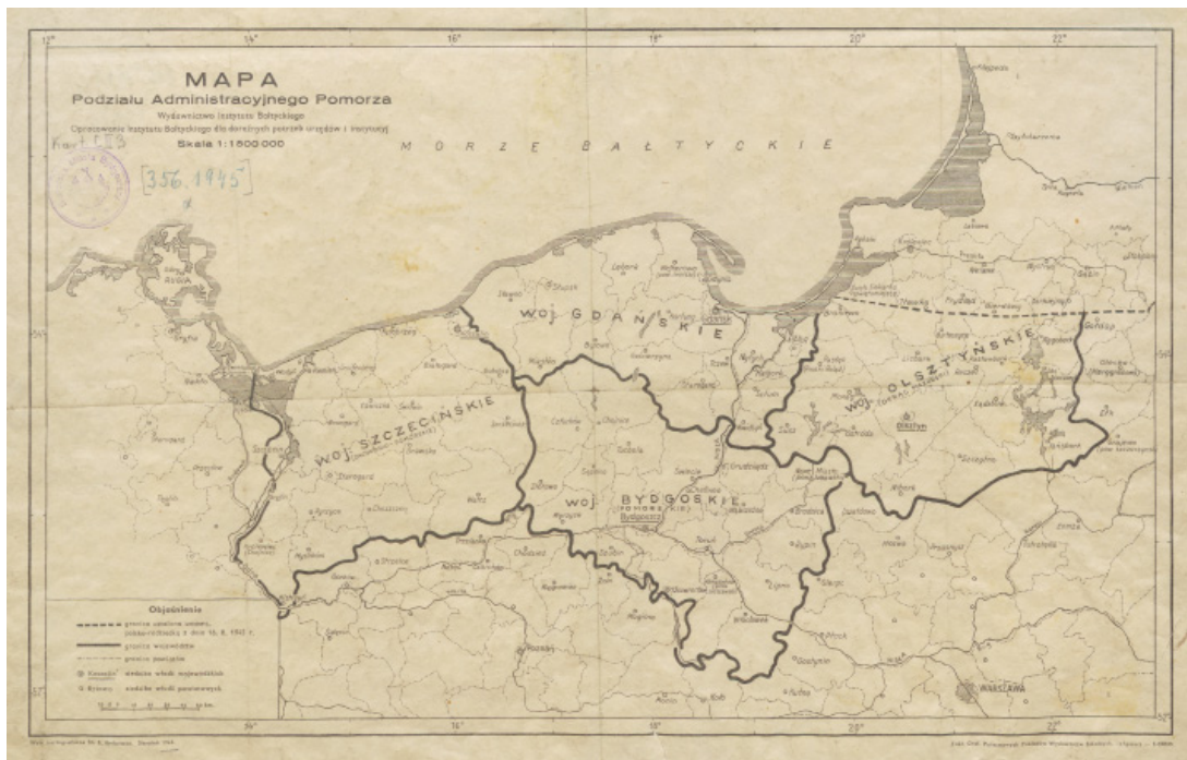
Ryc. 1. Mapa administracyjna Pomorza z 1945 r. z województwem pomorskim uwzględniająca podział na powiaty. Skala 1:1 500 000, Wydawnictwo Instytutu Bałtyckiego, sierpień 1945 r.