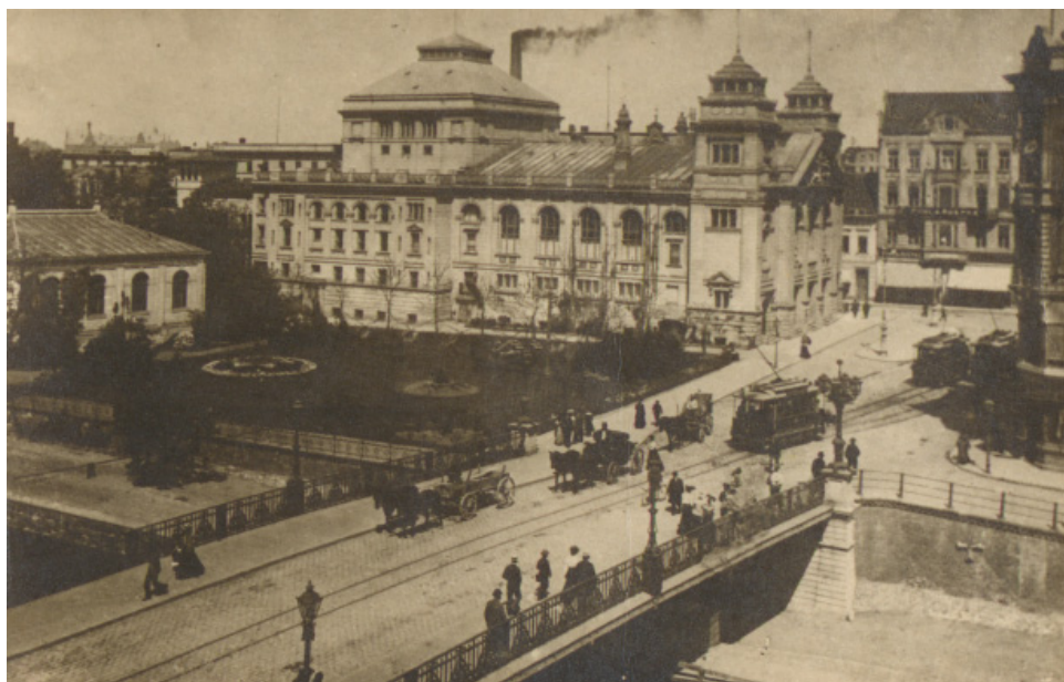
Ryc. 10. Teatr i Most Staromiejski w 1930 r. Autor nieznany. Źródło: Wojewódzka i Miejska Biblioteka Publiczna w Bydgoszczy, sygn. MAGS 81_12_01