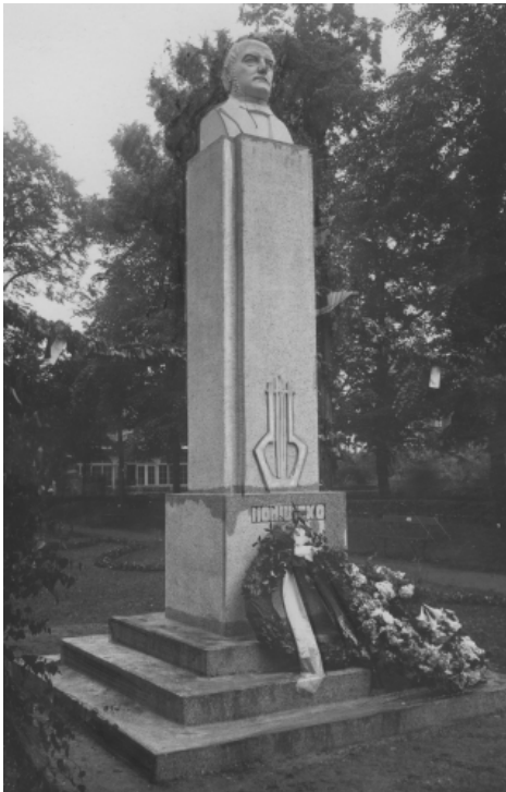
Ryc. 14. Pomnik Stanisława Moniuszki w ogrodzie Teatru Miejskiego w Grudziądzu w 1935 r. Autor: W. Grelewicz. Źródło: Narodowe Archiwum Cyfrowe, sygn. 3_1_0_9_1528_230321

Piechoty Ziemi Włocławskiej, Józefa Piłsudskiego;