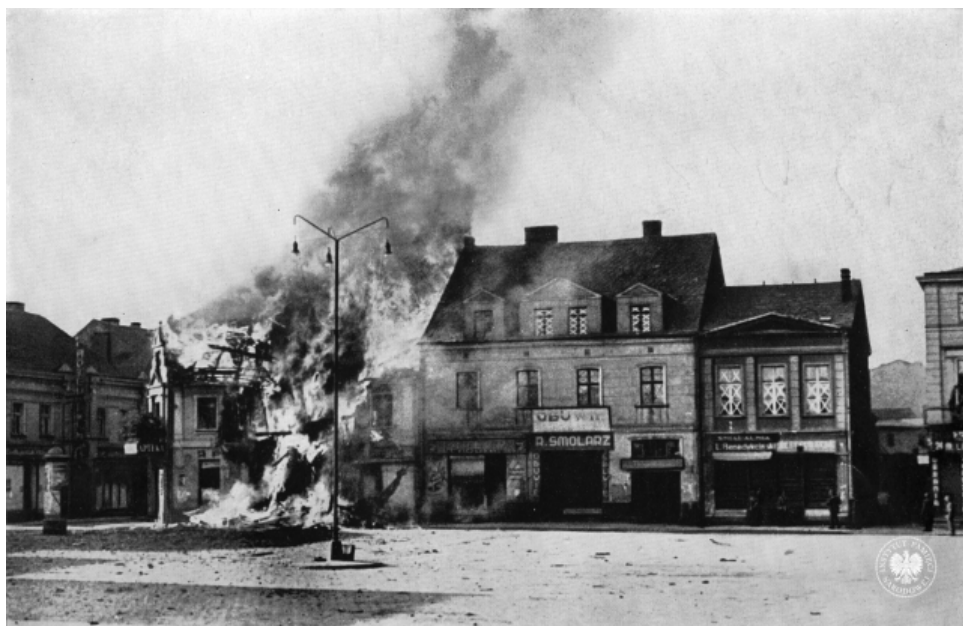
Ryc. 3. Płonąca apteka na rynku w Inowrocławiu, wrzesień 1939 r.