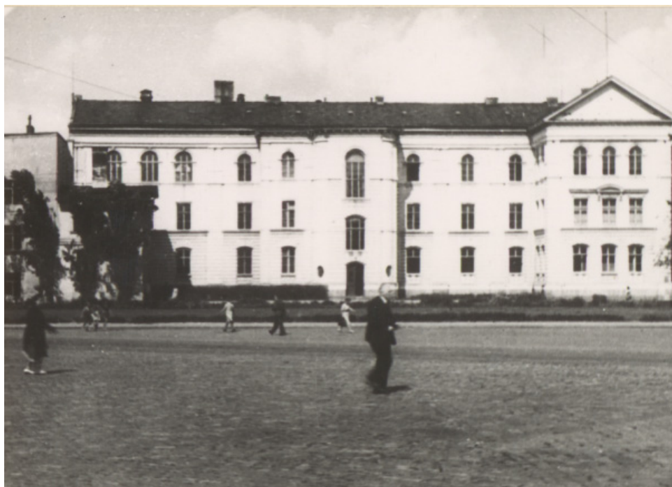
Ryc. 9. Rynek w Bydgoszczy w 1943 r. po zburzeniu kościoła Jezuitów. Autor nieznany. Źródło: Wojewódzka i Miejska Biblioteka Publiczna w Bydgoszczy, sygn. MAGS 814_20_01