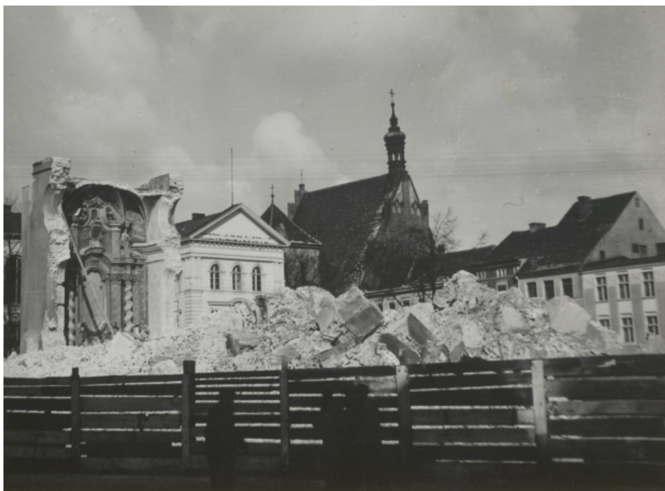
Ryc. 8. Kościół Jezuitów na Rynku w Bydgoszczy zburzony przez Niemców. Autor nieznany.

Źródło: Wojewódzka i Miejska Biblioteka Publiczna w Bydgoszczy, sygn. MAGS 814_15_01