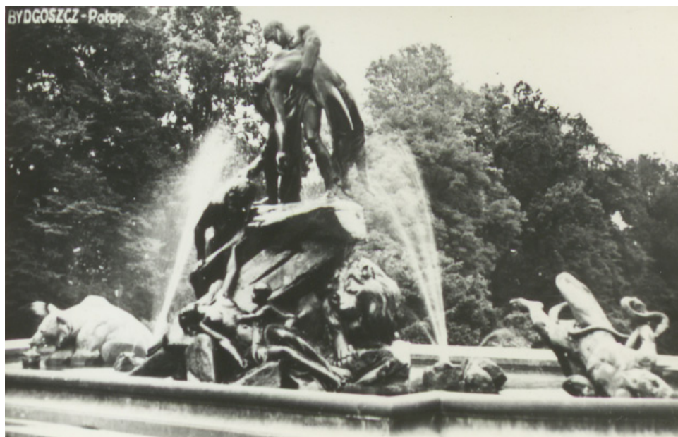
Ryc. 15. Fontanna „Potop” w Bydgoszczy zniszczona przez Niemców w czasie okupacji. Autor nieznany.

Źródło: Wojewódzka i Miejska Biblioteka Publiczna w Bydgoszczy, sygn. MAGS 1244_B_1