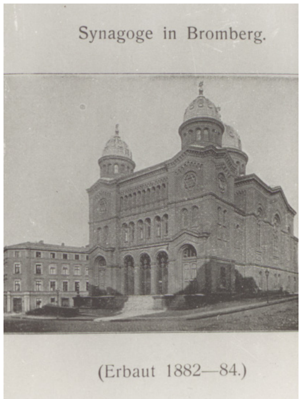
Ryc. 6. Synagoga w Bydgoszczy zniszczona przez Niemców. Autor nieznanym.

Bydgoszcz może być przykładem na to, jak trudne jest jednoznaczne wskazanie zniszczeń z okresu wojny. W marcu 1945 r. tutejszy ZM wskazywał, że – jak to określono – w czasie działań wojennych całkowicie zniszczone przez pożary zostały 34 budynki, poważniej ucierpiało – 85, natomiast mniej uszkodzonych było ok. 400 63 . Według dokumentu Wydziału Budowlanego UWP, na podstawie danych z lipca 1945 r., w Bydgoszczy istniało 8490 budynków, z czego zniszczone lub uszkodzone zostały 294 (3,5%) 64 . W styczniu 1946 r. ZM informował urząd wojewódzki, że Niemcy podczas okupacji rozebrali w mieście 57 budynków, a w czasie działań wojennych zniszczeniu uległo 58 65 . W tym czasie zdaniem Komitetu Miejskiego Polskiej Partii Robotniczej wskutek działań wojennych ubyło 80 budynków mieszkalnych 66 .